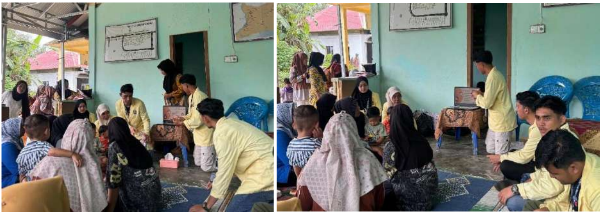
Gambar 2. Pelaksanaan Penyuluhan Stunting di Posyandu