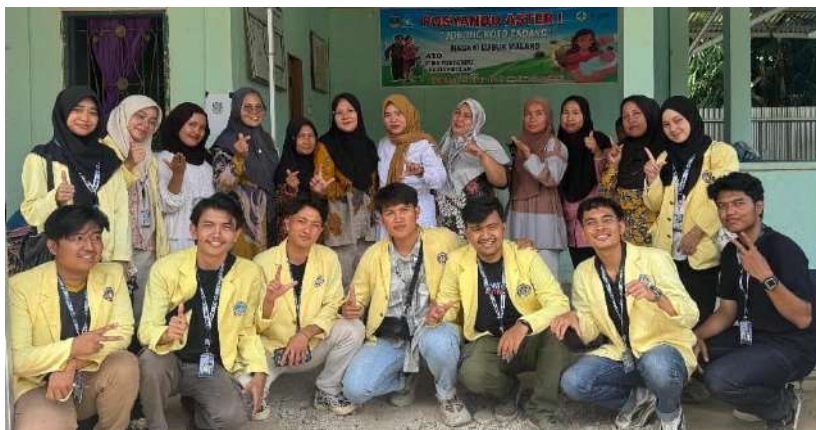
Gambar 4. Foto Bersama Peserta dan Kader Posyandu

Berdasarkan dokumentasi kegiatan yang ditampilkan, dapat dilihat bahwa seluruh rangkaian penyuluhan stunting berlangsung secara terstruktur dan partisipatif. Kegiatan tidak hanya berfokus pada penyampaian materi, tetapi juga melibatkan interaksi aktif antara mahasiswa KKN dan masyarakat, khususnya ibu balita, melalui sesi diskusi dan tanya jawab. Hal ini menunjukkan bahwa pendekatan penyuluhan yang digunakan mampu menciptakan suasana yang komunikatif dan kondusif, sehingga memudahkan peserta dalam memahami informasi yang disampaikan. Selain itu, keterlibatan kader Posyandu sebagai mitra kegiatan turut mendukung kelancaran pelaksanaan serta meningkatkan kepercayaan masyarakat terhadap kegiatan yang dilakukan.