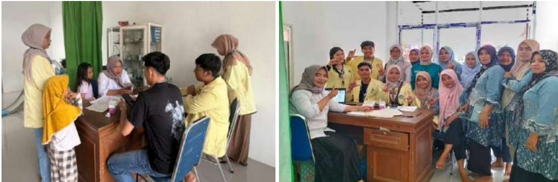
Gambar 1. Koordinasi dengan Pihak Posyandu Aster I Jorong Koto Gadang

menunjukkan bahwa penyuluhan tidak hanya bersifat satu arah, tetapi juga mendorong partisipasi aktif masyarakat dalam memahami isu stunting.