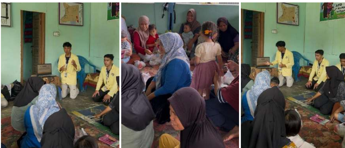
Gambar 3. Sesi Diskusi dan Tanya Jawab dengan Peserta