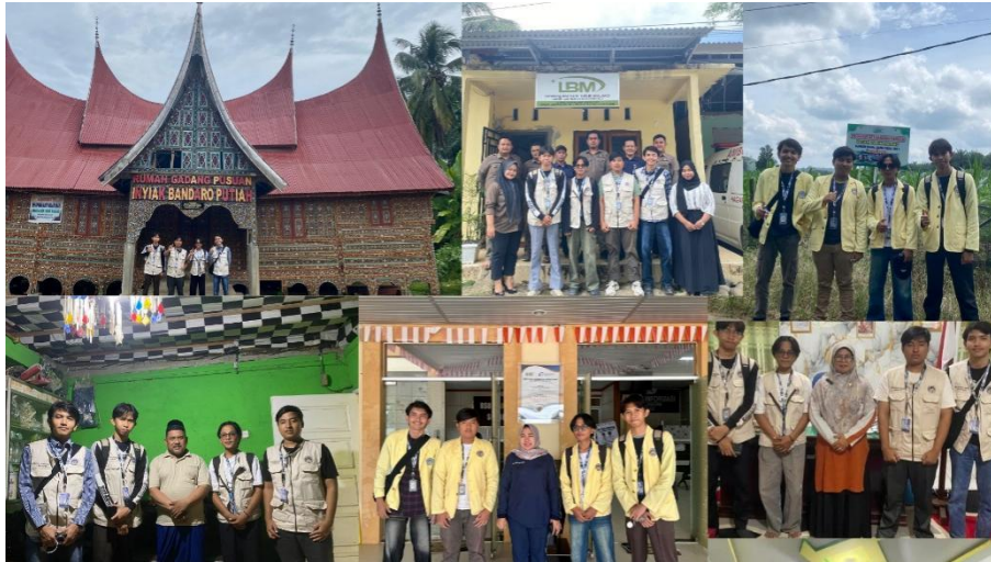
Gambar 2. Dokumentasi kegiatan observasi dan pendataan fasilitas pelayanan publik di Nagari Lubuk Malako.

Lubuk Malako, meliputi BUMNag, puskesmas, institusi pendidikan, hingga cagar budaya Rumah Gadang. Representasi kegiatan observasi dan inventarisasi pada beberapa fasilitas publik tersebut dapat dilihat pada Gambar 2.