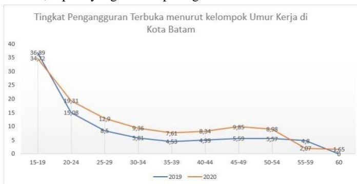
Gambar2. Tingkat pengangguran Terbuka 2019-2020

Menurut data Badan Pusat Statistik Batam, angka pengangguran mengalami peningkatan selama setahun terakhir, seperti yang terlihat pada gambar berikut.